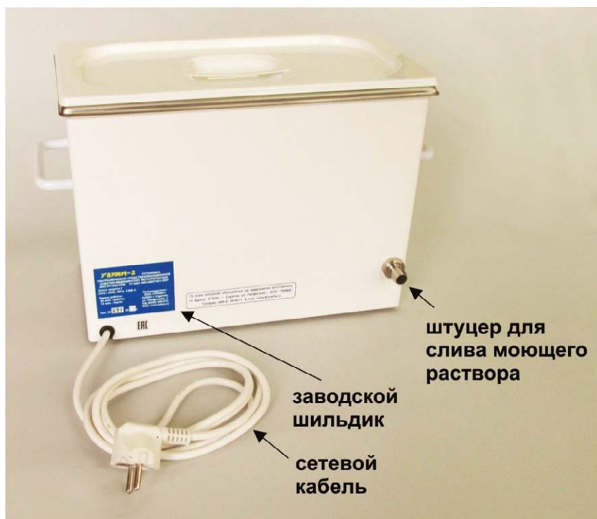
Рис.4. Элементы конструкции задней стенки корпуса установки "УЗУМИ-2".

На задней стенке корпуса (Рис.4) в противоположном от сливного штуцера углу находится вывод сетевого кабеля, а над ним заводской шильдик с серийным номером установки и годом её выпуска.