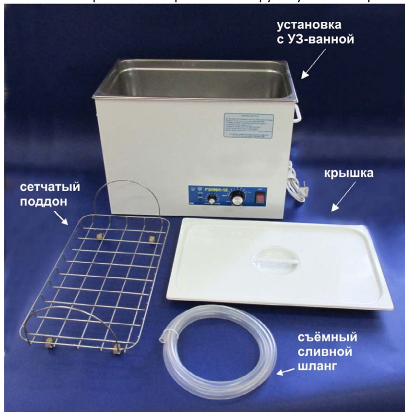
Рис.1. Внешний вид установки и комплект её поставки.

Слева от переключателя расположена ручка установки времени ультразвуковой обработки (таймер).