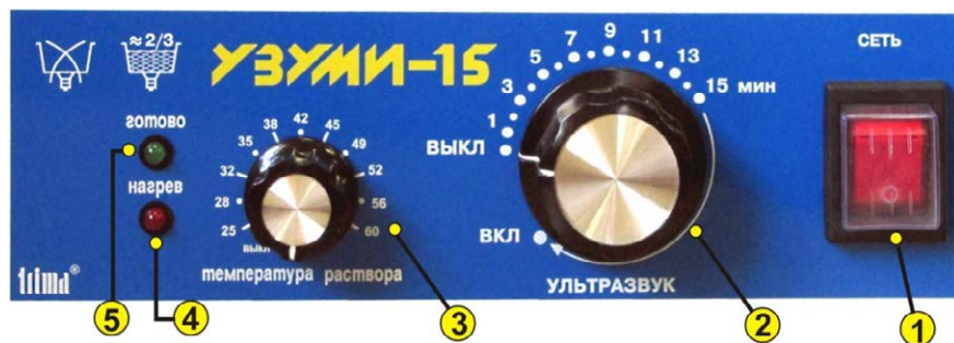
Рис.2. Панель управления установки "УЗУМИ-15".