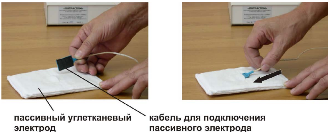
Рис.4. Подключение кабеля к пассивному электроду.

Для подключения к активному и пассивному электродам в комплект поставки входят два кабеля. С одного конца оба кабеля имеют одинаковые штекеры для соединения с выходными гнездами на передней панели приставки. Противоположные концы кабелей отличаются. Второй конец кабеля для подключения пассивного электрода представляет собой пластину на одной поверхности, которой находится углетканевый электропроводящий материал. Этой стороной пластина вставляется в прорезь ткани пассивного электрода, предварительно смоченного в физиологическом растворе или воде Рис.4.