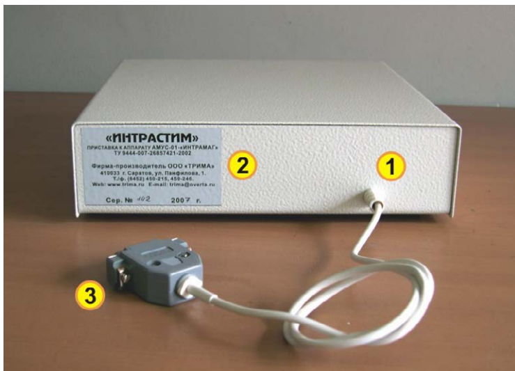
Рис.3. 1 - Вывод кабеля питания приставки 2 - Шильдик с заводским номером 3 - Разъем для подключения к разъему «ВЫХОД-2» аппарата АМУС-01-«ИНТРАМАГ».

Для подключения к активному и пассивному электродам в комплект поставки входят два кабеля. С одного конца оба кабеля имеют одинаковые штекеры для соединения с выходными гнездами на передней панели приставки. Противоположные концы кабелей отличаются. Второй конец кабеля для подключения пассивного электрода представляет собой пластину на одной поверхности, которой находится углетканевый электропроводящий материал. Этой стороной пластина вставляется в прорезь ткани пассивного электрода, предварительно смоченного в физиологическом растворе или воде Рис.4.