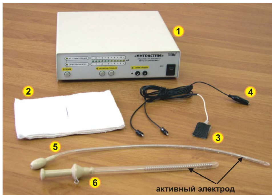
Рис. 1. Общий вид приставки «ИНТРАСТИМ».

В одном корпусе конструктивно размещены два электронных блока для осуществления процедур электростимуляции и электрофореза.