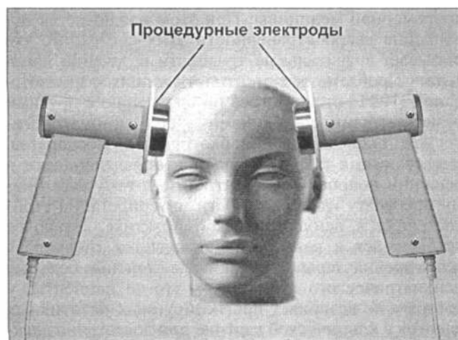
Рис. 2. Схема билатерального наложения процедурных электродов аппарата ЭСТЕР при проведении процедуры ЭСТ. зависимости от характера и степени редукции патологического состояния.

1 — электронный блок, 2 — процедурные электроды.