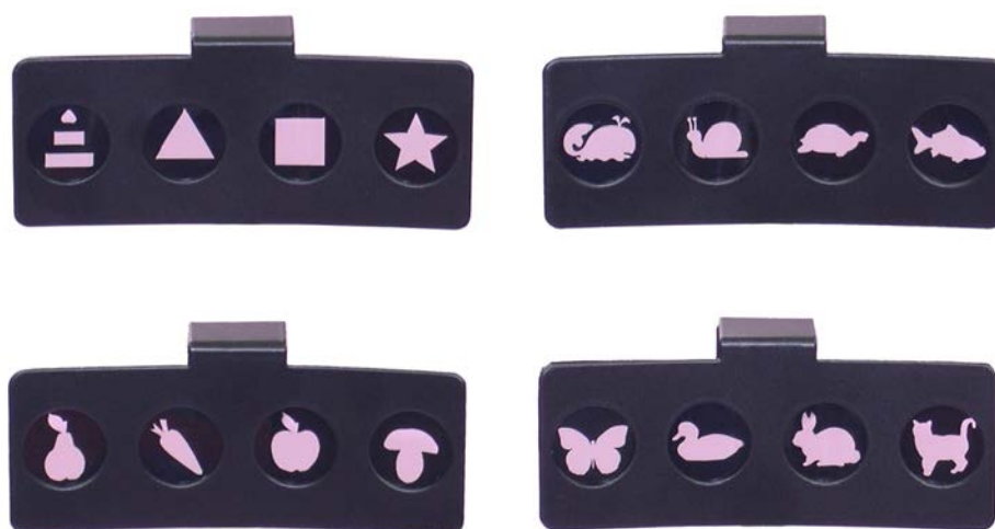
Рис.3. Набор накладок на периметрическую дугу для работы с детьми дошкольного возраста.

С целью повышения занимательности и фиксации внимания при работе с детьми дошкольного возраста в комплекте поставки аппарата имеется набор из 4-х накладок на периметрическую дугу (рис.3.)