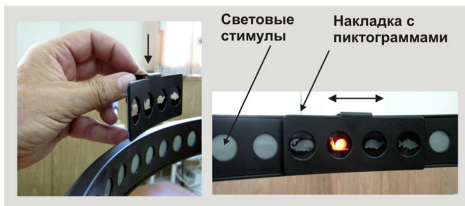
Рис.4. Установка наклейки на периметрическую дугу.

С внутренней стороны наклейки, в верхней её части, установлен постоянный магнит. Наклейка устанавливается сверху на дугу (рис.4) и, удерживаясь на её поверхности, может легко перемещаться вдоль дуги, что позволяет устанавливать наклейку перед любыми четырьмя световыми стимулами.