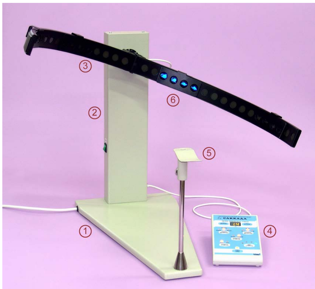
Рис.1. Общий вид аппарата "САККАДА".

В угловых положениях 90^\circ ; 135^\circ ; 180^\circ ; 225^\circ дуга имеет лёгкую фиксацию.