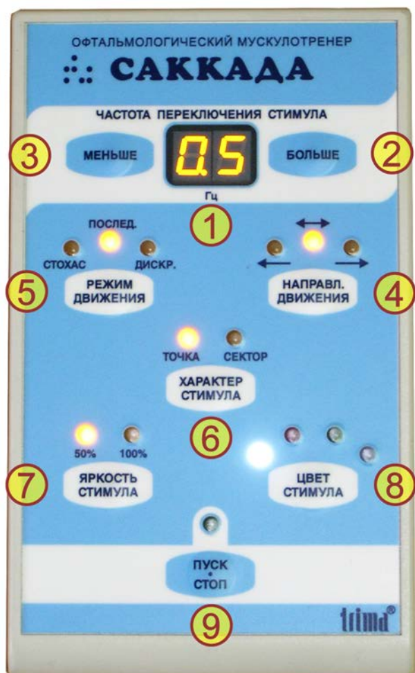
Рис.2. Передняя панель аппарата "САККАДА".

На передней панели пульта управления расположены следующие органы управления и индикации (рис.2).