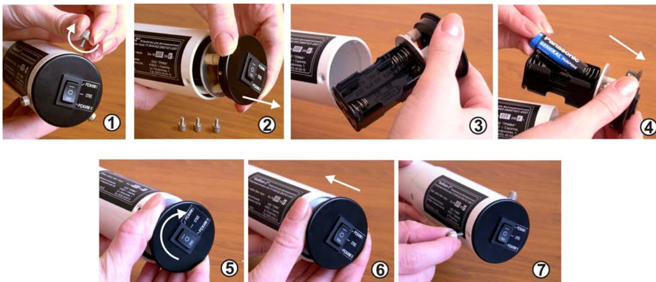
Рис.6. Порядок установки (замены) элементов питания

8.4. Перевести переключатель на задней стенке в положение "РЕЖИМ - I" и, приблизив устройство окном на передней крышке к глазу, убедиться в последовательном "быстром" переключении световых стимулов.