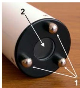
Рис.2. Расположение магнитопроводов на передней крышке устройства. 1 - Магнитопроводы. 2 - Окно для наблюдения за фотостимулами.

На передней части корпуса жестко закреплена крышка с центральным окном для наблюдения за фотостимулами во время проведения процедуры. На внешней стороне этой крышки под углом 120^{\circ} относительно друга расположены три магнитопровода для осуществления магнитотерапии (Рис.2). С внутренней стороны крышки торец каждого магнитопровода соединен с постоянным магнитом.