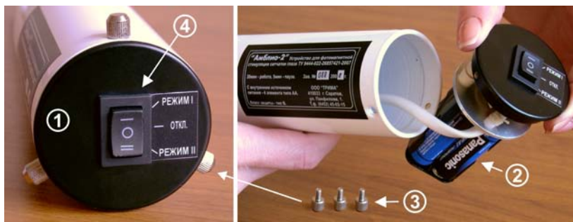
Рис.3. Задняя крышка устройства с отсеком для элементов питания и переключателем режимов работы.

С внешней стороны задней крышки находится переключатель для включения устройства в работу и выбора режимов предъявления фотостимулов.