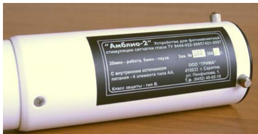
Рис.4. Расположение заводского шильдика на боковой поверхности устройства.

На боковой поверхности корпуса устройства ближе его задней крышке расположен заводской шильдик с названием устройства, серийным номером и годом выпуска (Рис.4).