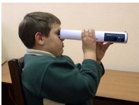
Рис.7. Положение больного при проведении процедуры лечения амблиопии с помощью устройства "АМБЛИО-2".

При этом магнитопроводы, расположенные на передней крышке устройства должны упираться в орбиту глаза.