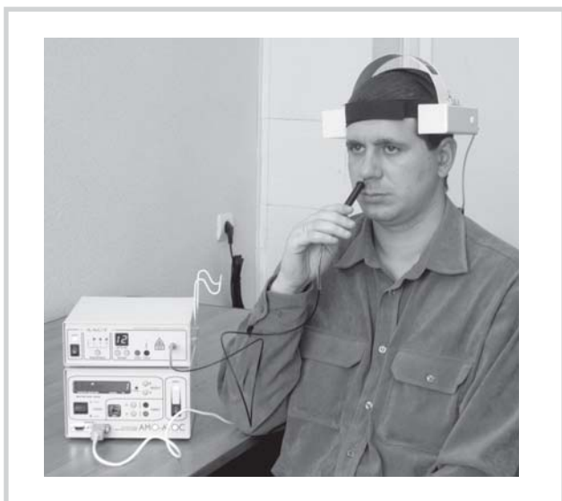
Рис. 1. Методика проведения транскраниальной магнитотерапии в сочетании с лазертерапией эндонозально с помощью аппаратов АМО-АТОС с приставкой Оголовье и ЛАСТ-ЛОР.

стоит из двух полуцилиндрических излучателей БИМП, в каждом из которых располагается ряд соленоидов, коммутируемых последовательно с частотой, регулируемой в диапазоне 1—16 Гц. Частота поля, излучаемого каждым соленоидом, составляет 50 или 100 Гц в зависимости от выбранного режима. Организованное таким образом БИМП воздействует на голову пациента битемпорально (рис 1). Процедуры назначали ежедневно с экспозицией 10—15 мин, увеличивая частоту движения поля постепенно от сеанса к сеансу, начиная от 1 Гц в начале курса и до 10—12 Гц к концу. Курс лечения 10 сеансов.