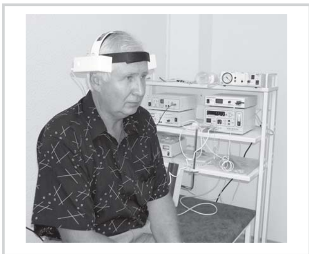
Рис.1. Методика проведения ТкМТ с помощью приставки Оголовье аппаратного комплекса АМУС-01—Интрамаг.